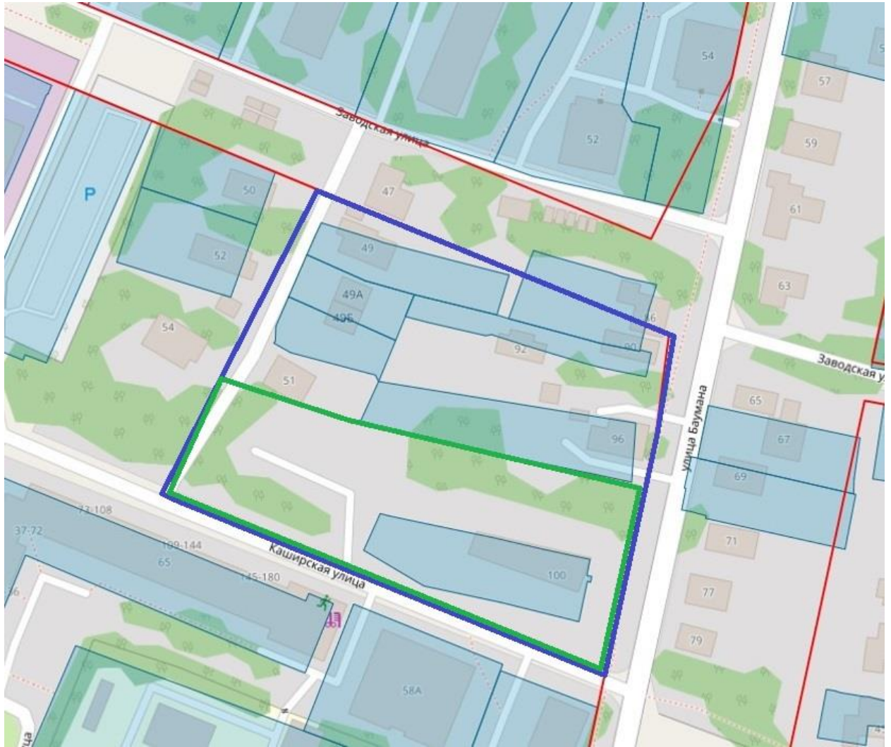
Схема границ подготовки инженерных изысканий